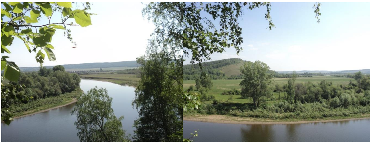
Фото 1. Родовые земли башкирских кланов мурзалар, айле, кудей и тырнаклы из линии i1-Z140 на Южном Урале

только сарматские, аланские, гуннские и угрофинские племена. Но данные этногеномики показывают, что на Южном Урале до сих пор проживают также и потомки германских (готских), и балтских племён. О потомках готов, а именно об остготах и пойдёт речь в данном исследовании.