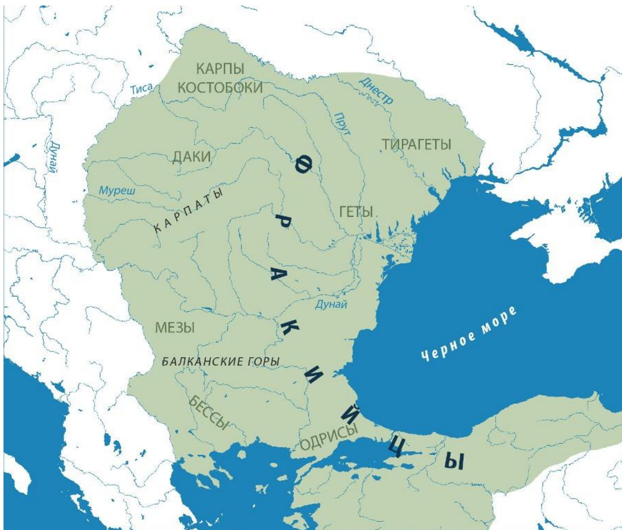
Карта 2. Фракийцы – предки клана Макагоновых 13809у

Характерные черты внешности потомков иллирийцев — худощавость, стройность, высокий рост, преимущественно чёрные волосы[9], схожими чертами обладали и родственными им фракийцы с Карпат.