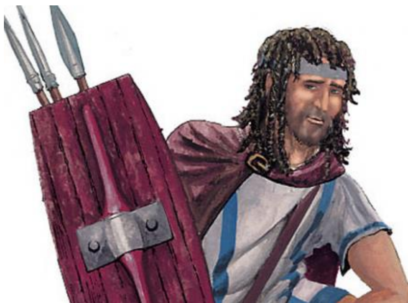
Репринт 2. Иллирийский воин[7]

Это в частности население венгерского Кёрёш, локальный вариант старчево-кришской культуры (VII-V тыс. до н.э., i2a)[4] и культуры Лепенски-Вир (VI тыс. до н.э., i2-M438, i2a2a-L34)[5]. Старчево-кришцы относились к средиземноморской расе, тогда как потомки культуры Лепенского Вира сохраняли более черты мезолитических кроманьонцев[6].