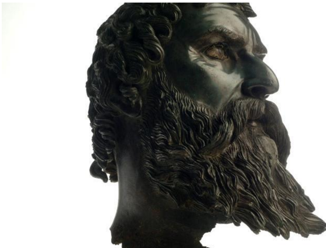
Репринт 1. Фракиец

Макагоновы 13809у из гаплогруппы i2a – потомки древнейшего населения Европы.