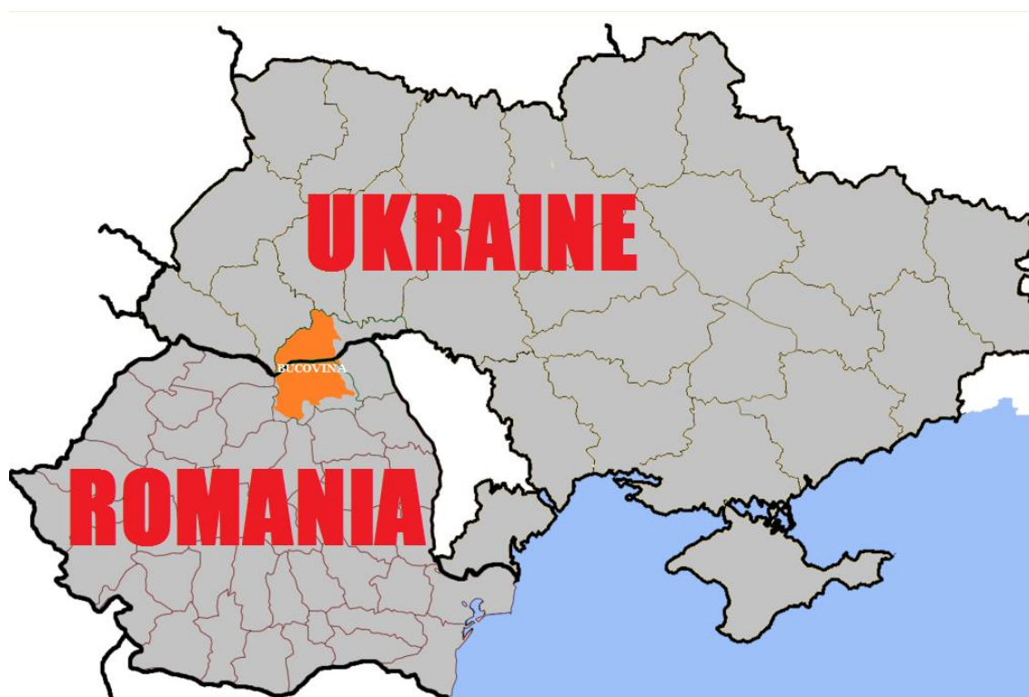
Карта 1. Буковина на картах Украины и Румынии

Прародина клана части Макагоновых 13809у (по отцовской линии) – Буковина, территория Румынии, северная часть которой сейчас входит в Украину.