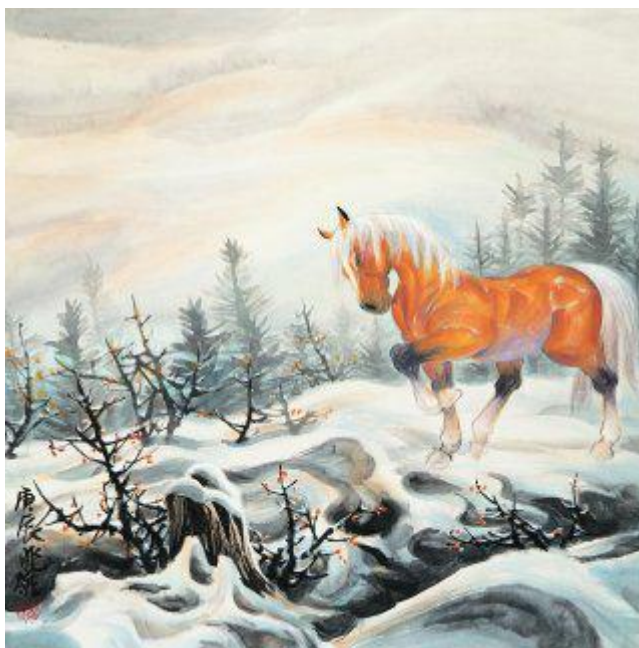
Рис. 2. Солнечный крылатый конь Хакмара