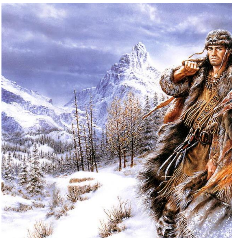
Рис. 1. Хакмар, племянник Урала, духовный наставник тех носителей R1b, кто выбрал нравственный путь Урала

Бурзяне, относятся к потомкам Хакмара, т.е. к сыну Шульгена. Хакмар, согласно эпосу, не принимает сторону своего отца Шульгена и уходит от него с его западной страны на восток, к своему родному дяде Уралу и в страну его сыновей – Иделя (русов), Нугуша (асов) и Яика (саков)[4].