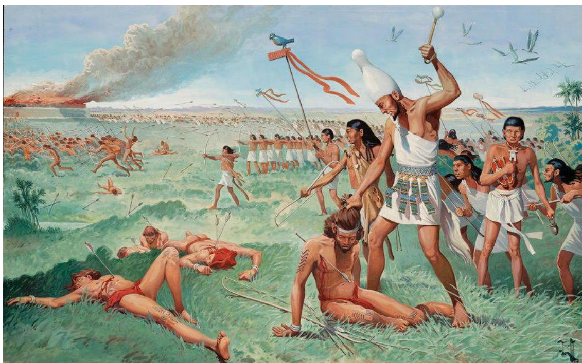
Рис.1. Пеласги и их битва с дорийцами[2]

* Исследования Л. А. Гиндина и В. Л. Цымбурского, относят древний народ пеласгов к ранней популяции индоевропейцев на Балканах[1], в связи с этим предполагаю, что пеласги были древними предками греко-италийских племён, и родственных им балто-славянских племён. Придерживаюсь мнения, что предки пеласгов, пришли на Балканы и Апеннинский полуостров с Центральной Европы и Балтики.