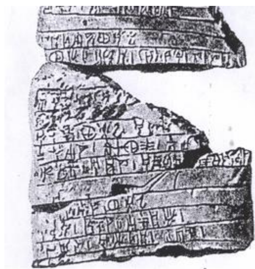
Репринт 1. Нижняя строчка среднего — «пеласгийского» фрагмента.

Совмещенные буквы — славянская «Ж» и «латинская» заглавная «R» — сокращенное «жрец». «OTI» — отец, а вместе с окончанием «te» — основа будущих слов «отчество», «отечество»?