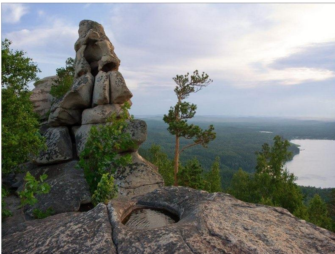
Фото 1. Урал

присогдийские и прочие, они относятся к большой сарматской макро-семье. Только продвинувшиеся более остальных сарматских племен к северу. К Приуралью. Они вклинились в тот район. Но это не значит, что Приуралье их исконное место происхождения. Обитание это еще не есть истоки! Их происхождение не становится «уральским», если они даже там обитают. В общем, Кузнецов аорсов сильно «урализировал» и тем самым посчитал, что скрепил две породы племен – аорсов с аланами. Представил их одноэтничными, иранского происхождения.