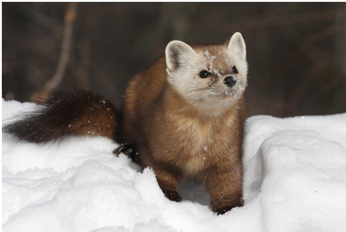
Фото 2. Куница

«Что касается владения Янь, то, как указано в "Хоу Хань шу", оно располагалось к северу от Яньцай и платило Кангюю дань шкурками зверьков мышиной породы.