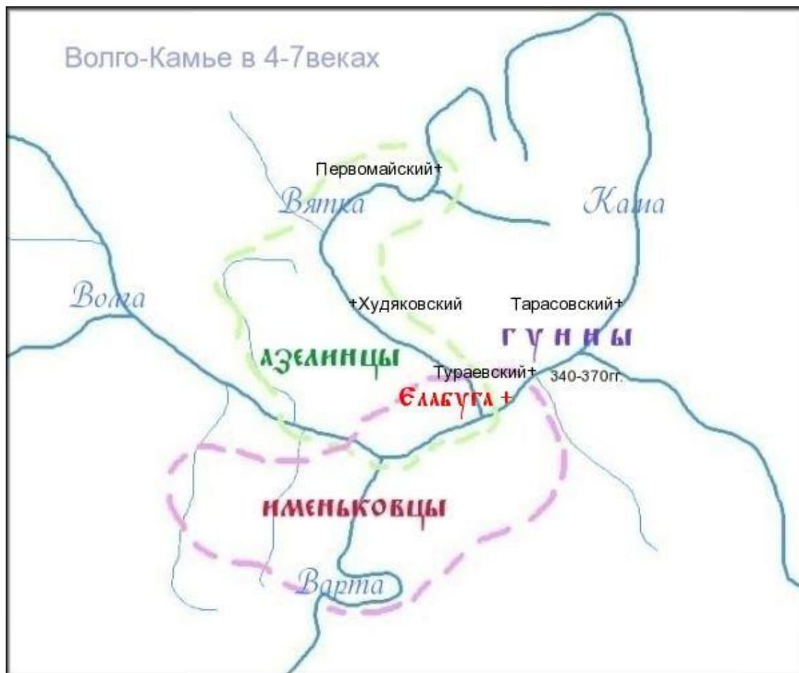
Карта 2. Именьковцы и их соседи в IV-VII вв. н.э.

Позднее потомки именьковцев частично вошли в состав волжских болгар, и с принятием ислама ныне известны как поволжские татары.