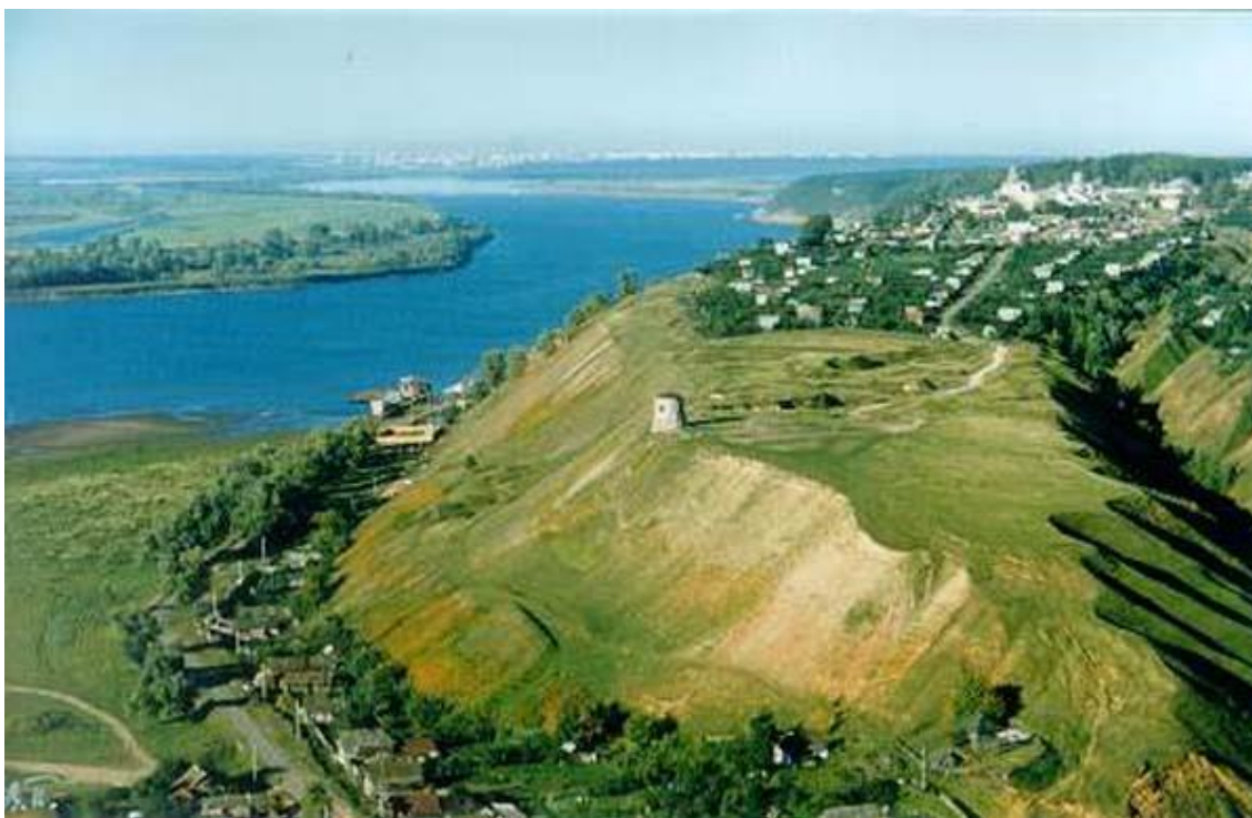
Фото 1. Елабуга

В древности в этом месте была переправа через Каму. Само название Елабуга или Алабуга можно связать с упоминаемой в саге усадьбе "У Камня". Буга в переводе с татарского "бык", – так часто называли речные камни-скалы, а сейчас быками называют мощные опоры мостов. Крепость Алаборг фигурирует в сагах о походах в Биармию как самая отдаленная её местность – за тремя лесами (волоками-водоразделами).