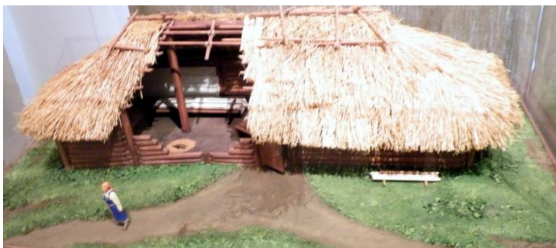
Фото 1. Жилище именьковской культуры (Национальный музей в Казани)

Согласно результатам ДНК-теста, гаплотип Юсупова попадает в субклад R1a-Z92. Происхождение данного субклада в Поволжье в том числе связано с населением именьковской археологической культуры[3], с балто-славянскими племенами.