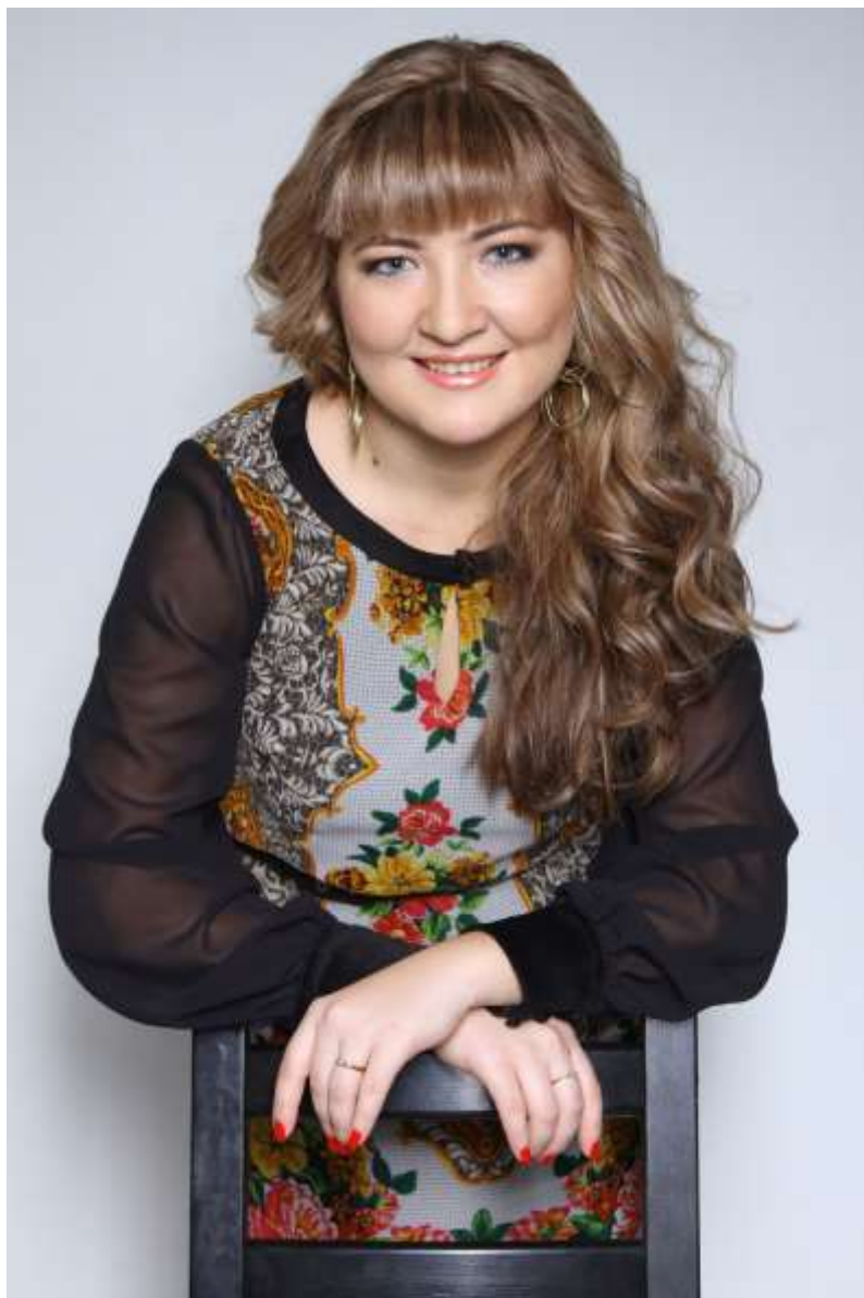
Фото 2. Нугай-куль-иль-минская башкирка.