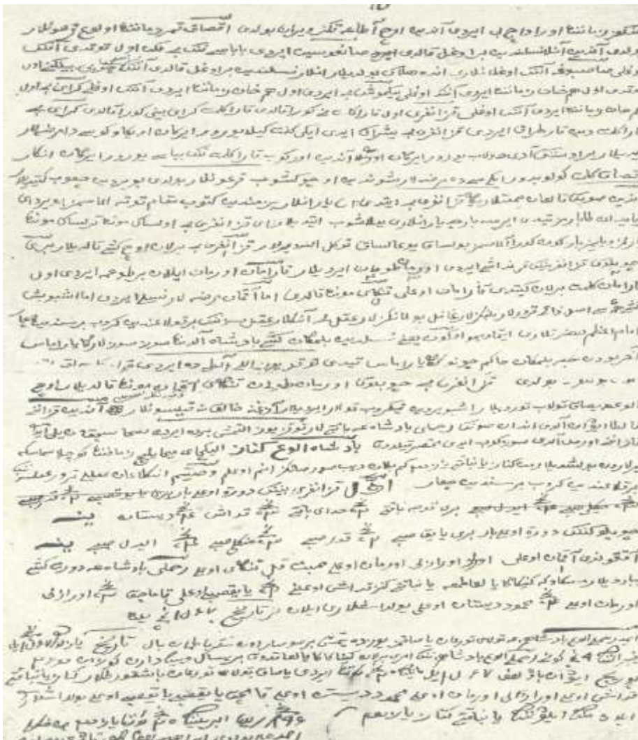
Репринт 1. Оригинал шежере минских башкир

Здесь следует обратить внимание на следующие аспекты, рассказчик в шежере отмечает: «Очевидно [он] нашему Илькэю и Мамбету не родня». Илькэй считается родоначальником илькуль минских башкир, то есть парного клана к куль-илькуль минским башкирам, и рассказчик сразу оговаривается, что потомки Худайбирде (данного Богом) – не родня Илькэю.