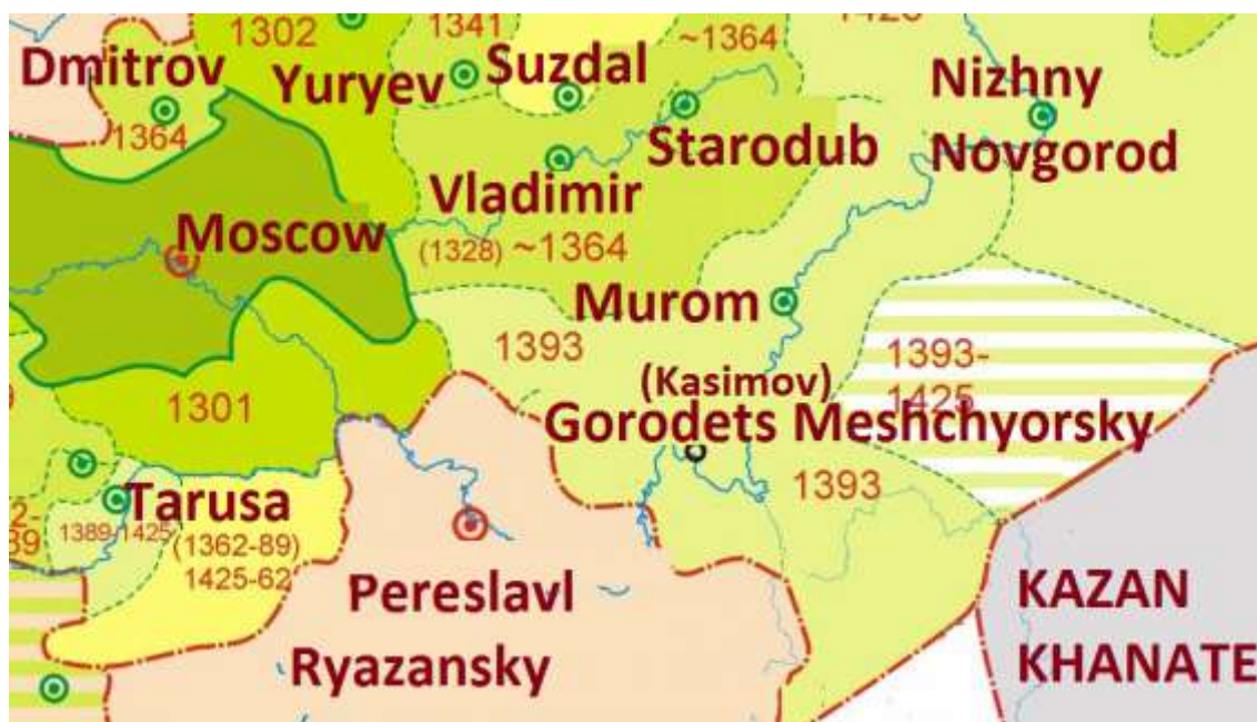
Карта 2. Казанское ханство и его соседи в XVI веке

Помимо огромного выкупа за свое освобождение (200 тыс. рублей) московский великий князь вынужден был отдать брату казанского хана Махмутека Касиму город Городец Мещерский с частью Мещерского края, на территории которого и возникло Касимовское ханство. Тогда же по договору были предусмотрены поступления денежных выплат в пользу касимовских царей, их князей, казначеев и даруг как из Московского великого княжества, так и из Рязани. Кроме городца, ордынцам были переданы другие города с их волостями. Так царевици Касим и Якуб в 1449-1493 года управляли Звенигородом, в 1486-1517 гг. Каширой правили царевици Нурдаulet и Абдул-Латиф, также касимовским ханам были переданы города Калуга, Тверь, Торжок, Вологда и Белоозерье[8].