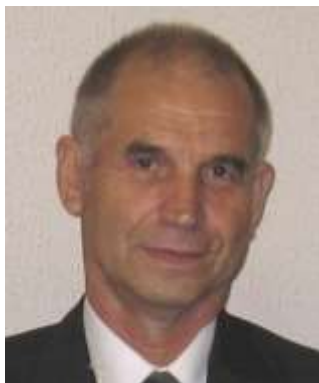
4114yseq, Daukaev Tatar, E1b