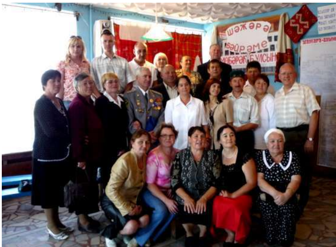
Фото 2. Члены рода Даукаевых на празднике шежере-байрам в селе Казарма, июнь 2009

В Мензелинском уезде Салагуш-Байларской волости, на берегу небольшой речки Ауерлан, впадающей в р. Тиргавеш (притока рек Ик и Кама), было образовано поселение село Деуково (Даукай). В последующем с 1708 г. село входило в Уфимский уезд Казанской губернии Байларской волости.