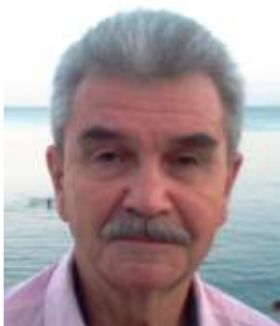
Фото 2. Туркмен-кубовский башкир J2

Есть и генеалогическое подтверждение о происхождении туркмен-кубовских башкир от чуйских тюрков из клана кубань-сураш. У усерганских башкир кланы шешей и бешей согласно шежере считаются потомками Сураша[17].