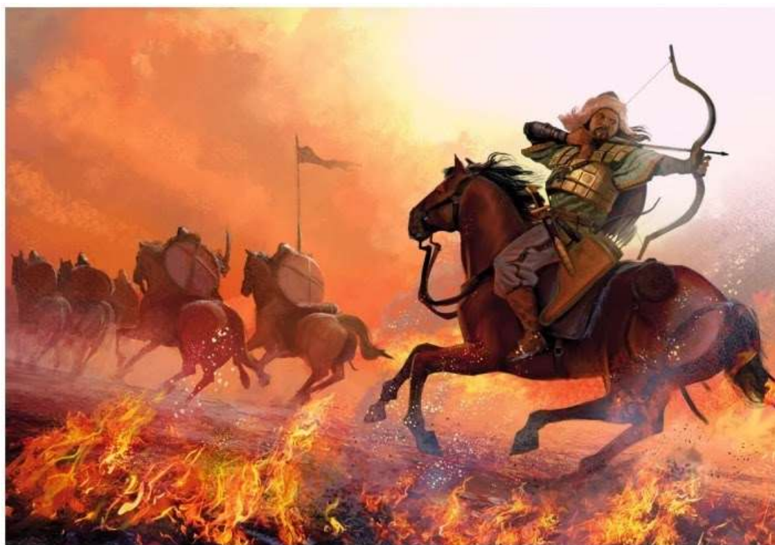
Рис. 1. Воин из союза племён дулу

Сам этноним qobau — значит 'часть, доля'[13] с древнетюркских языков, поскольку потомки малосильных среднеазиатских хуннов обозначались как шесть кланов, или по-тюркски — алты чуб. Одно из поколений этих алты чубов, предки кубовских башкир и были известны как клан сураш. Позднее в эпоху Дешти-Кипчака кубань-сураши вошли в состав кипчаков, тогда как их южные сородичи кубань-кошсу вошли в состав огузов. Слово 'кубань' у сурашей трансформировалось в прилагательное, qoba/quba на тюркских — 'белокурые, буланы, бледно-бурые'[14], 'светлые, каурые'[15], что свидетельствовало о вхождении кубань-сурашей в XI веке в состав половцев — сары, и о дальнейшем расселении потомков кубань-сурашей на запад[16].