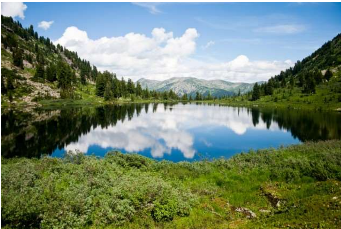
Фото 1. Урал – родная земля кубовских башкир

А вот тамга кубовских башкир сохранилась древняя – она схожа с тамгой шешей-, бешей-, апанды-, абазы- усерганских башкир. И кубовские башкиры и усерганские башкиры перечисленных выше кланов согласно данным ДНК-теста имеют общее древнее происхождение (субклады гаплогруппы J2), более того в эпоху Тюркского каганата предки башкир из кланов кобау и вышеперечисленных усерганских кланов проживали вместе и были известны под именем кубань-сурашей и шешети, входивших в союз племён дулу.