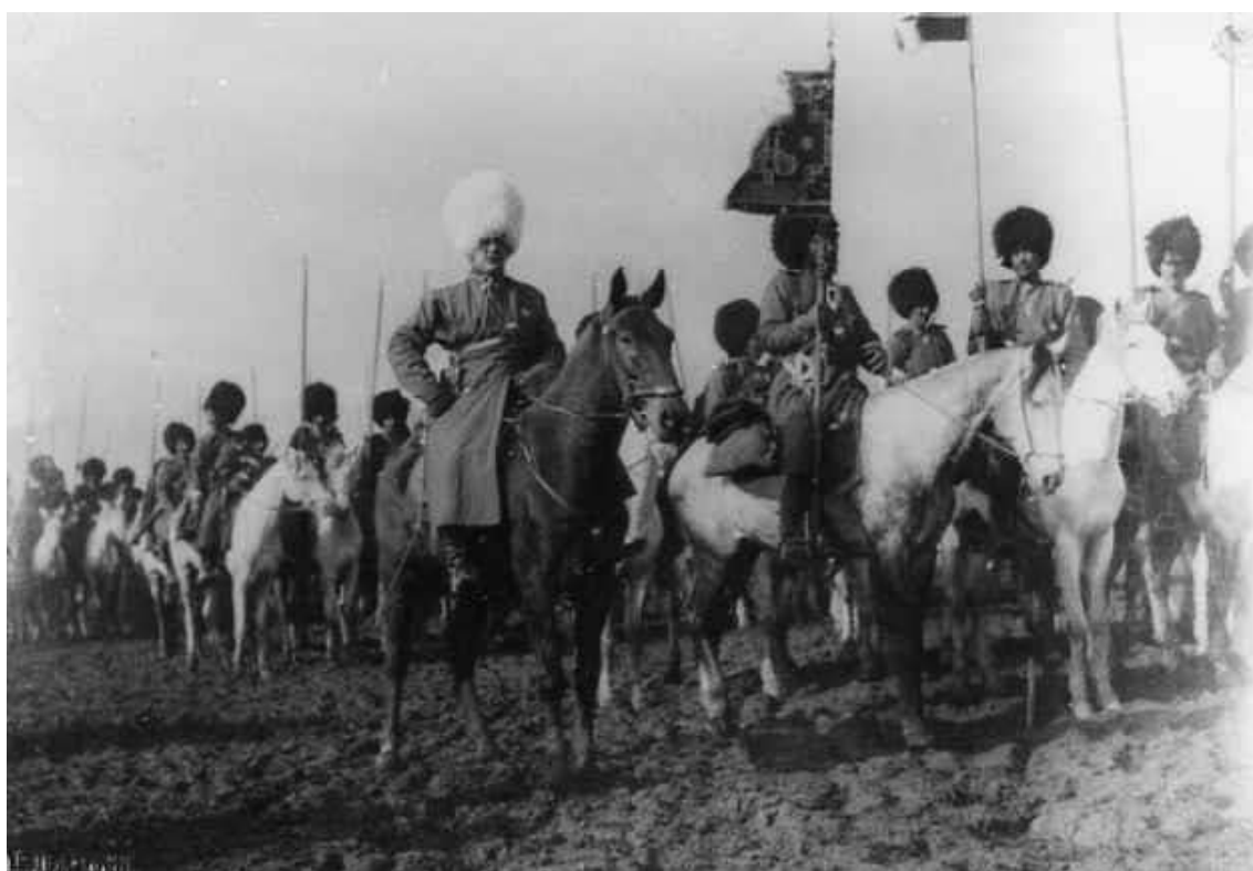
Репринт 1. Штандартный эскадрон Текинского конного полка, нач. XX века

Среди приближенцев[11] к туркмен-кубовским башкирам встречаются турки-текели из Анатолии, HR4PZ Tekeli, Turkey, 12 23 14 11 13-16 11 15 12 14 11 31, которые связаны со второй южной ветвью кубанов – кошсу (сокольниками), в эпоху Тюркского каганата входивших в союз племён нушиби. Кубань-сураши расселялись в Приаралье и на реке Чу, тогда как их сородичи кубань-кошсу жили южнее в районе Серахса и Хорезма. Потомки кубань-сурашей ныне сохранились у туркмен-текинцев, юрюков и у турков-текели из Анатолии.