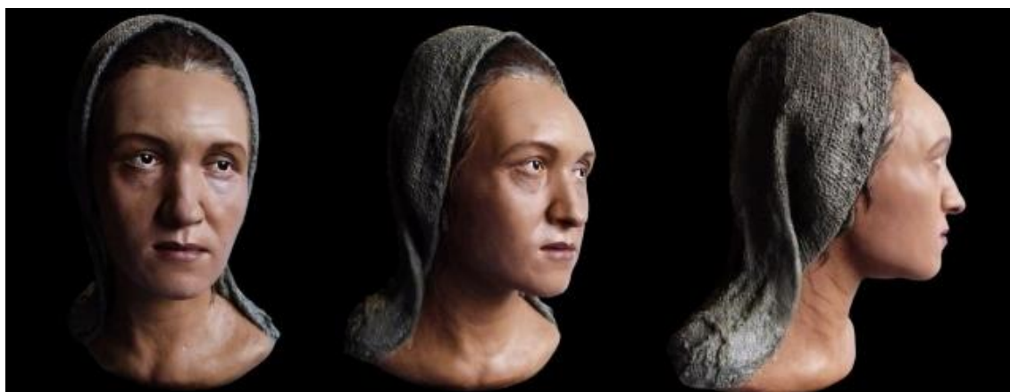
Фото 1. Реконструкция сарматской женщины II-III в. с искусственной деформацией черепа (автор реконструкции А.И. Нечвалода)

Среди коренного населения Волго-Уральского региона в частности встречается понтийский антропологический тип (Трофимова, 1948, С.58-59; Бунак, 1965, С.191-247), который исследователи связывают с аланами. В памятниках типа Лбище обнаружен череп одного из погребенных со следами искусственной деформации, характерный для поздних сарматов. Схожие захоронения есть в селище Сиделькинское II (Сташенков, 2010, С.274).