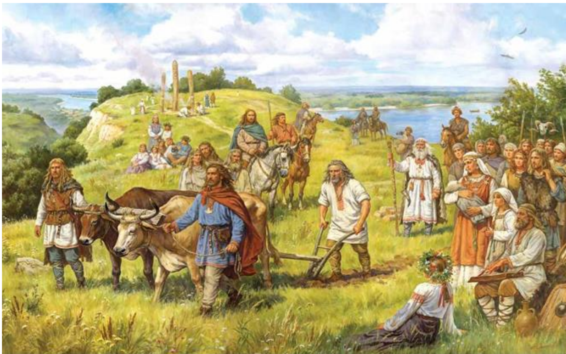
Орлыонов А. О., «Кий, Щек, Хорив і Либідь засновують місто Київ. 482 рік»

‘рус/рос’ (русские), и ‘арсу/эрзят’ (эрзя), носители всех этих этнонимов, согласно данным этногеномики – R1a, как западные R1a-Z282 (русские, эрзя), так и восточные R1a-Z93 (потомки ариев).