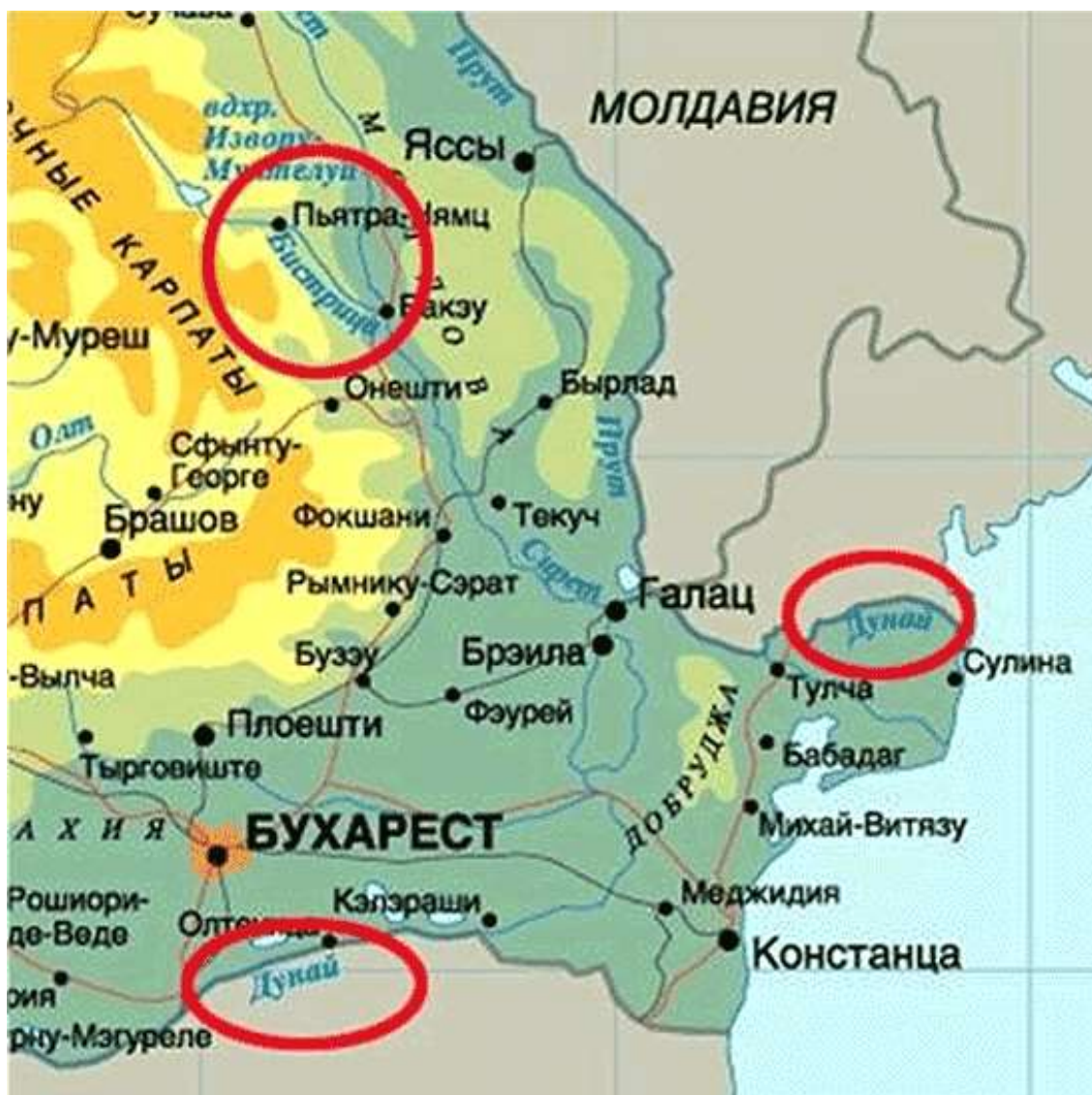
Рис. 2. Карта бассейна нижнего течения Дуная

Отсюда и пошла путаница. Дело в том, что недалеко от устья в Дунай впадает река Серет, главным притоком которого является Бистрица. Установление же истины, какая из рек является основным истоком, а какая всего лишь ее притоком, являлось большой проблемой с момента возникновения географии.