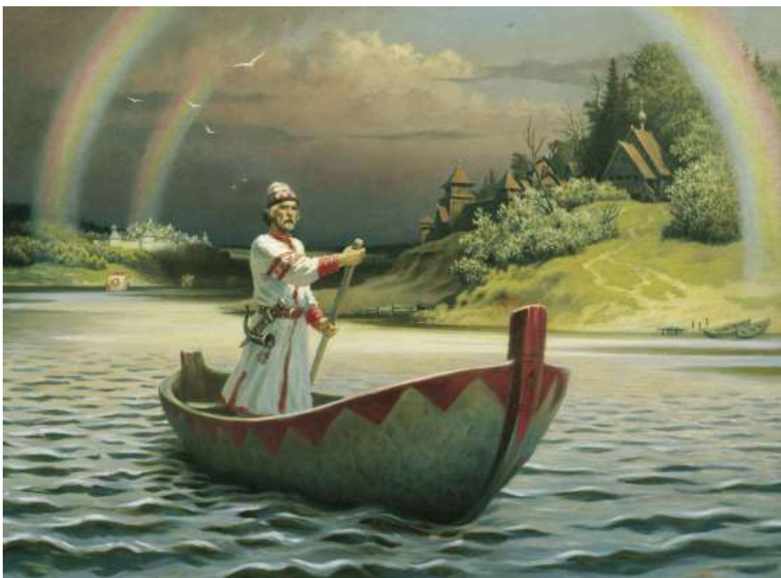
Рис. 1. Древняя Русь. Художник Б.М.Ольшанский ©

Аутентичные известия монголов про Русь и русских 1-й половины XIII в. находились в документах официоза Монгольской империи.