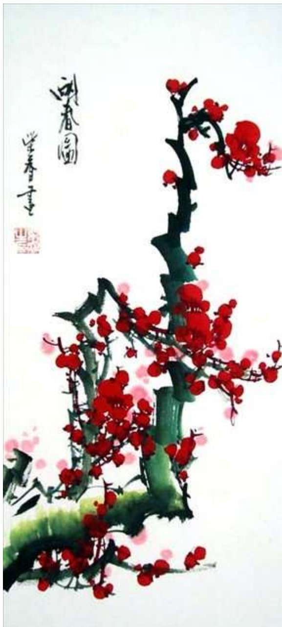
Репринт 2. Цветущая слива. Художник Чай Руи ©. Китайская фреска из оформления праздничного переиздания Юань Ши

И, во-вторых, — это данные «Юань ши» о мероприятиях монгольских имперских властей по отношению к Руси в период 1253-1257 гг.