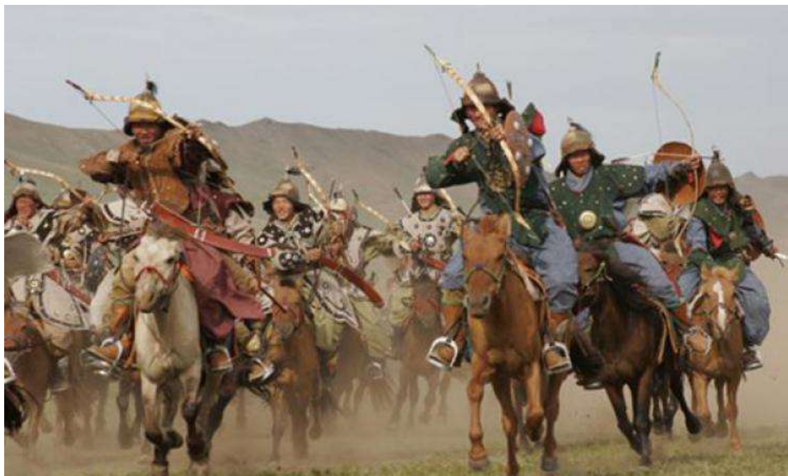
Фото 1. Монгольские войска (кадр из фильма)

Данная работа основывается на сообщениях из перечисленных источников первой группы, сведения из второй группы привлекаются только для сравнения.