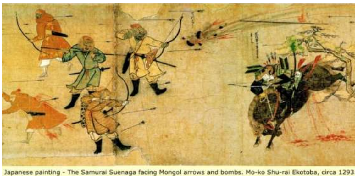
Рис.4. Древние монголы (японская фреска 1293 г.)

аланского г. Магас. Значение взятия русских городов отмечается также и в биографии (содержащейся в цз. 124 ЮШ) нойона Мэнгусара – великого судьи Монгольской империи и соратника Мэнгу (ставшего позднее кааном), который командовал одним из главных корпусов армии Бату в этом походе. В ней сохранен аутентичный текст указа Мэнгу-каана от 1254 г.: Мэнгусар «был с нами в карательном походе по усмирению городов русских, асов и олберлик-кипчаков, переправляясь через огромные реки – строил плоты, проходя походом горы – прокладывал дороги, атаковал города и сражался в поле» (ЮШ, стр. 3056).