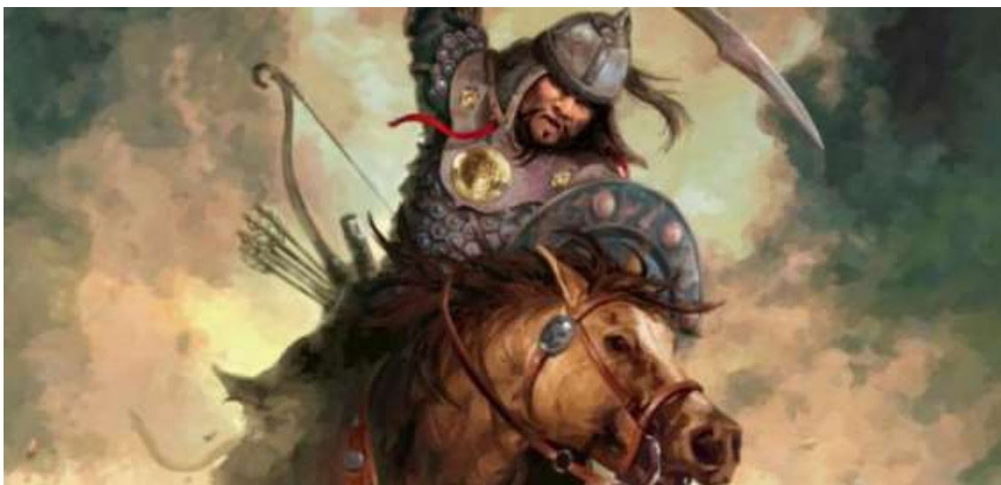
Рис.3. Хан Бату (Батый)

выделены только русские — помимо того, что они были поставлены вровень с основной целью, кипчаками, они названы как «люди, которые в ярости принимают смерть, бросаясь на собственные мечи. Мечи же у них, сказывают, остры». Т.е. тут еще можно отметить и реминисценции сражения на Калке, т.е. тех сведений, что появились после рейда Чжэбэ-Субэдэя, о которых упомянуто выше (Козин, стр. 192, Храпачевский 2013, стр. 96).