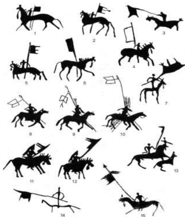
Репринт 1. Наскальная живопись древних кочевников Евразии

Последнее сообщение является дополнением и разъяснением пассажа в жизнеописании его отца Субэдэя, относящегося к 1239-1240 гг.: «Бату подал доклад [каану], [чтобы] прислали Субэдэя руководить сражением. Субэдэй набрал войско из хабичи, гэрун-ко'уд и прочих, [из числа которых] каждый пятидесятый человек последовал за ним». Дело тут в том, что примененные обороты китайской официальной истории о подаче упомянутого доклада императору маскировали как минимум проблемы, а если выразиться точнее, неудачи Бату в войне с русскими.