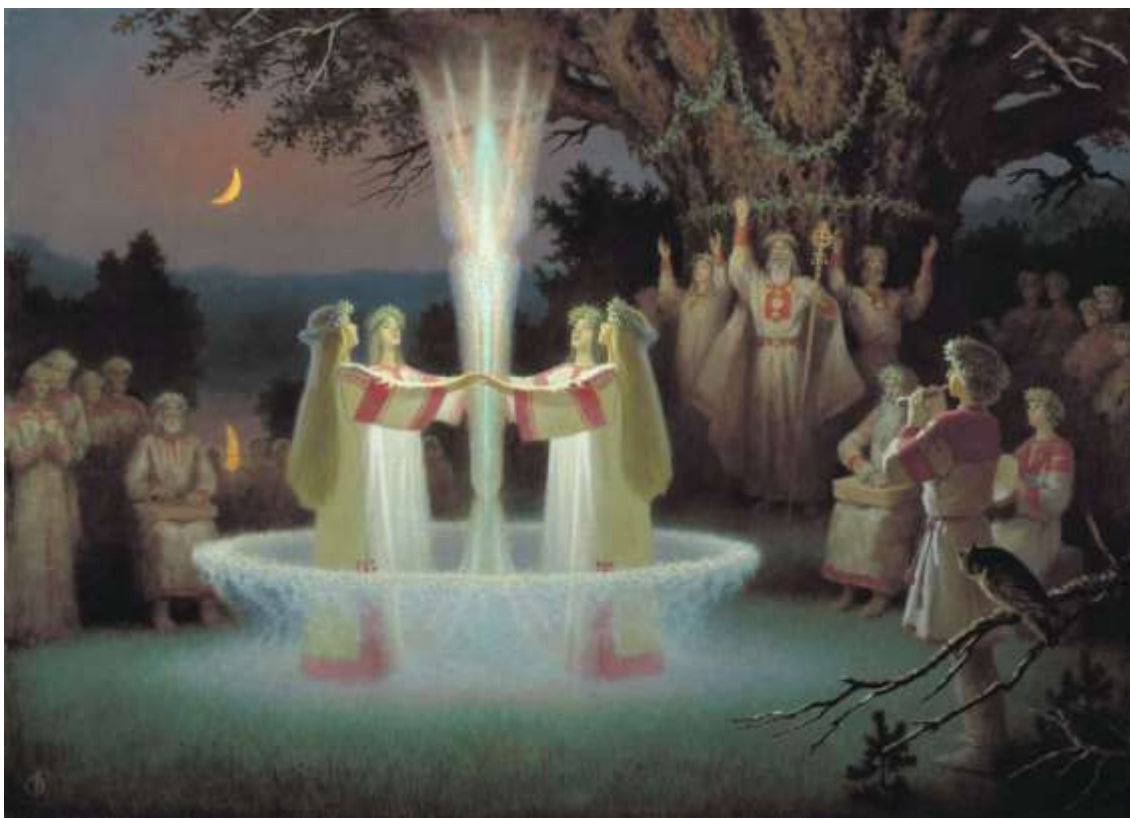
Рис.5. Ночь Ивана Купала (серия «Древняя Русь»). Художник Б.М.Ольшанский ©

Резюмируя все вышеизложенное, надо признать, что в целом комплекс сведений использованного выше монгольского круга источников о Руси и ее периферии по событиям 1236-1240 гг. хотя и отрывочен, но весьма разнообразен по охвату тем и событий, а также по перечню русских имен и топонимов. Встраивание этих данных в известный контекст сообщений русских источников представляется полезным в дальнейших разработках темы Батыева нашествия.