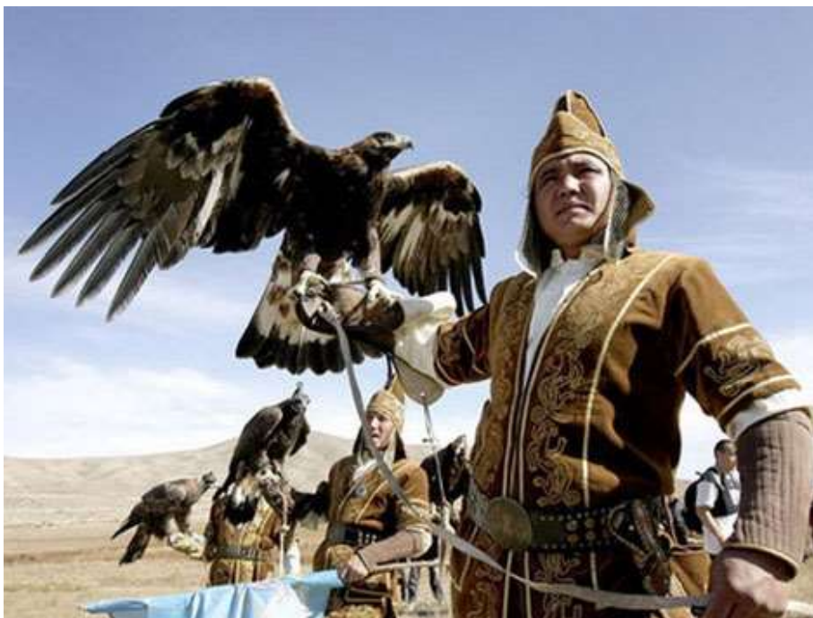
Фото 2. Кушчу — потомки номадов Дешти- Кипчака

Козельска; о том, что «[Субэдэй] в одном сражении захватил Юрия-бана» (отметим здесь, что в данном случае обнаруживается панегирическая приписка ему заслуг другого монгольского военачальника — Буралдая); а также о взятии войсками Субэдэя города Торческа (он назван «Торск» в тексте цз. 121 ЮШ) и что тогда же он «полностью взял тех русских, что относились [к населению Торческа]».