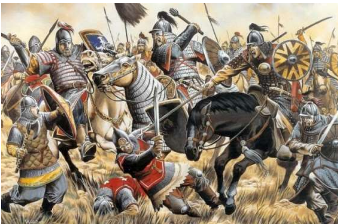
Рис.2. Сражение русских дружин с монгольским войском Субэдэя на реке Калке

Аналогичные сведения дают жизнеописания Субэдэя и Исмаила (подчиненного Чжэбэ) в составе «Юань ши». Но в них есть существенные дополнения к сведениям «Сокровенного сказания»: о сражении на Калке и его предыстории, о поражении асов-алан, русских, кипчаков и других кочевников Восточной Европы; о плене «старшего и младшего Мстиславов», причем решение о казни старшего из них принимал царевич Джучи (ЮШ, стр. 2969-2970, 2976, 3008); переходе на сторону монголов части кипчаков-половцев и их «рабов» (ЮШ, стр. 2976).