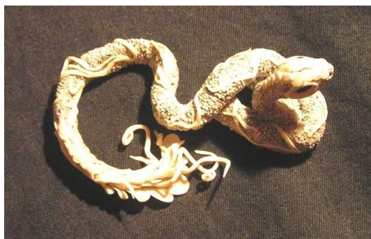
Фото 1. Белый змей – Шахмер

Аланы в башкирской родо-племенной структуре известны как клан елан. ‘Елан’ значит ‘змея’ с башкирского языка, и по смыслу совпадает с курдским и езидским культом поклонения белому змею, которого башкиры и курды называют одним именем – Шахмер.