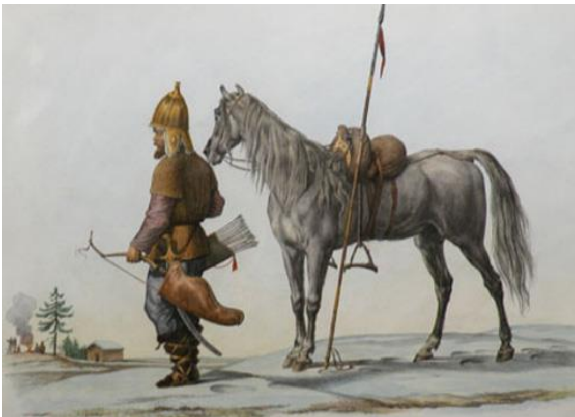
Фото 4. Башкирский воин

Абу Хамид аль Гарнати ясно и четко говорит, что при посещении им ранее Кавказа, он жил у эмира Абу-л-Касима. Этот эмир говорил на разных языках, такие как: лакзанский (лакский), табаланский (табасаранский), филакский (филяк – армянский?), закаланский, гумикский (гумик – кумыкский?, прим. Б.М.), хайдакский (кайтаки, говорящие на языке даргинской группы), сарирский (аварский), курдский, аланский (сармато-аланский), асский, зарихканский (?), тюркский, арабский, и персидский. То, что Абу-Хамид аль Гарнати подробно и без ошибок указал те народы Кавказа, которые известны под своими именами и сегодня, то это означает только одно – аланы Кавказа и осетины являлись в XII в. разными этническими группами. Нельзя забывать и тот факт, что у алан Кавказа в то время ещё были им родственные потомки сарматов-алан Урала.