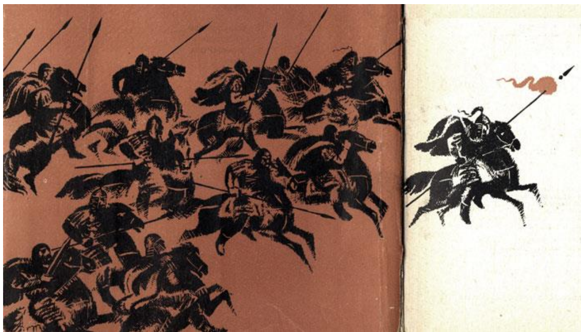
Фото 3. Сарматы

Другая часть аланов-сарматов была поглощена гуннами, и осела уже на территории современной Венгрии. Их потомков и видел в сирийском Курдистане в городе Алеппо (Халерб) Йакут аль Хамави (из г. Хама) 1179-1229 гг.