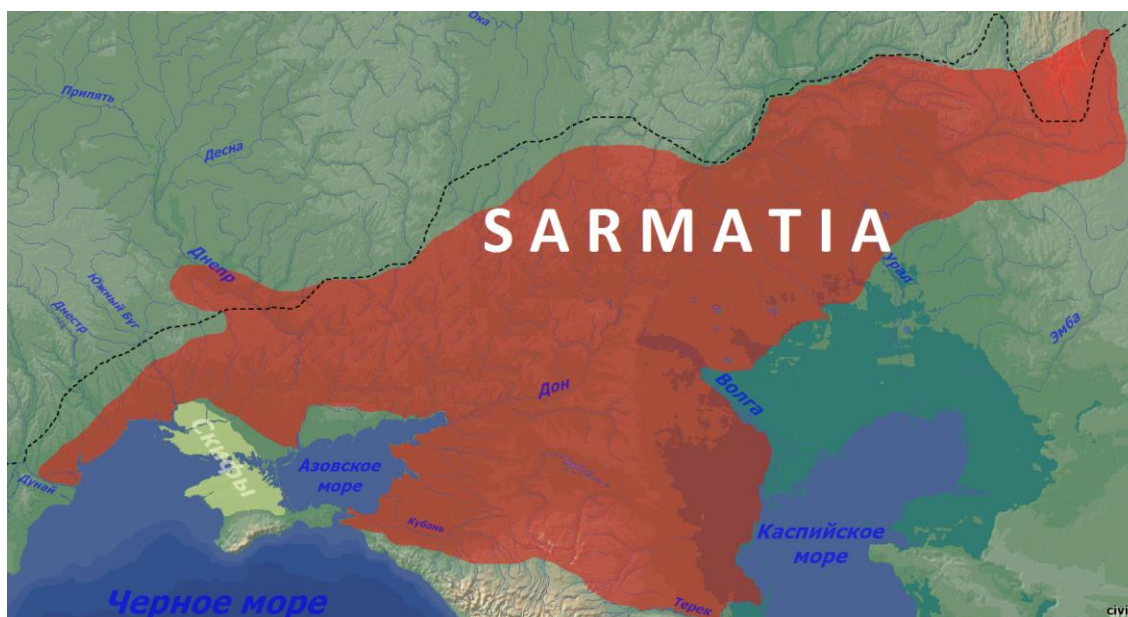
Фото 8. Территория расселения сарматских племён с III в. до н.э. по III в. н.э.

В этом описании Абу-Хамид аль Гарнати зирихгиранов мы встречаем и весь ритуал зороастрийцев, и культ ворона, известный у башкир Урала, а религия есть один из самых ярких этнических показателей на сегодняшний день. До наших дней в составе курдов живет род Алан и до настоящего времени в составе башкир сохраняется род юрматы – сарматы с которыми аланы в средние века состояли в этнополитическом, военном союзе. Последнее упоминание алан на Урале относится к XIII в. по Рашид ад Дину и Ибн-Асиру, а первые упоминания о которых восходят к I в. у римских писателей.