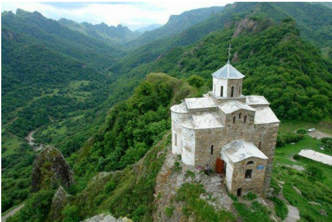
Фото 7. Аланский храм на Северном Кавказе

Они изготавливают всякое воинское снаряжение: кольчуги, и панцири, и шлемы, и мечи, и копья, и луки, и стрелы, и кинжалы, и всевозможные изделия из меди. Все их жены и сыновья, и дочери, и рабы, и рабыни занимаются всеми этими ремеслами. И хотя нет у них пашен и садов, добра и денег у них больше, чем у других, потому что со всех сторон привозят к ним люди всякие блага. Нет у них религии, но они не платят джизью. А когда умирает у них кто-нибудь, то отдают его мужчинам, которые в подземных домах; они отсекают члены мертвого, и освобождают кости от мяса и мозга, и собирают его мясо, и кормят им черных воронов, стоя с луками и не давая другим птицам съесть хоть что-то из его мяса.