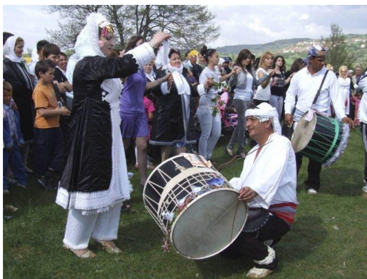
Фото 6. Курды- горани

Само имя ‘зирхгаран’ исконно курдское – «зирх» – ‘броня’, а также ‘зер’ – ‘золотой, блестящий’, ‘гаран’ – ‘горан’ – ‘обхватывать, держать’, а также является родоплеменным этнонимом курдов – ‘горан-гуран’. По видимому, эти ‘зирхгараны’ были не принявшими не мусульманства и христианства, а сохранившимися аланами или частью их. Абу-Хамид аль Гарнати описывает этих зирхгаран так: «А не далеко от Дербента есть большая гора, у подножия которой – два селения; в них живет народность, которую называют зирхгаран, т.е. бронники (‘кузнецы’ – прим. С.А.).