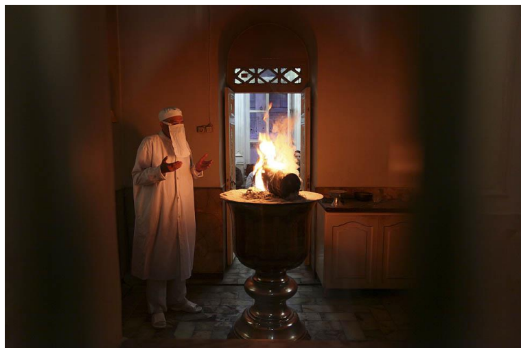
Фото 5. Зороастрийский священник

Ведь священный огонь, согласно зороастризму – святая стихия, и мертвое тело не должно его касаться.