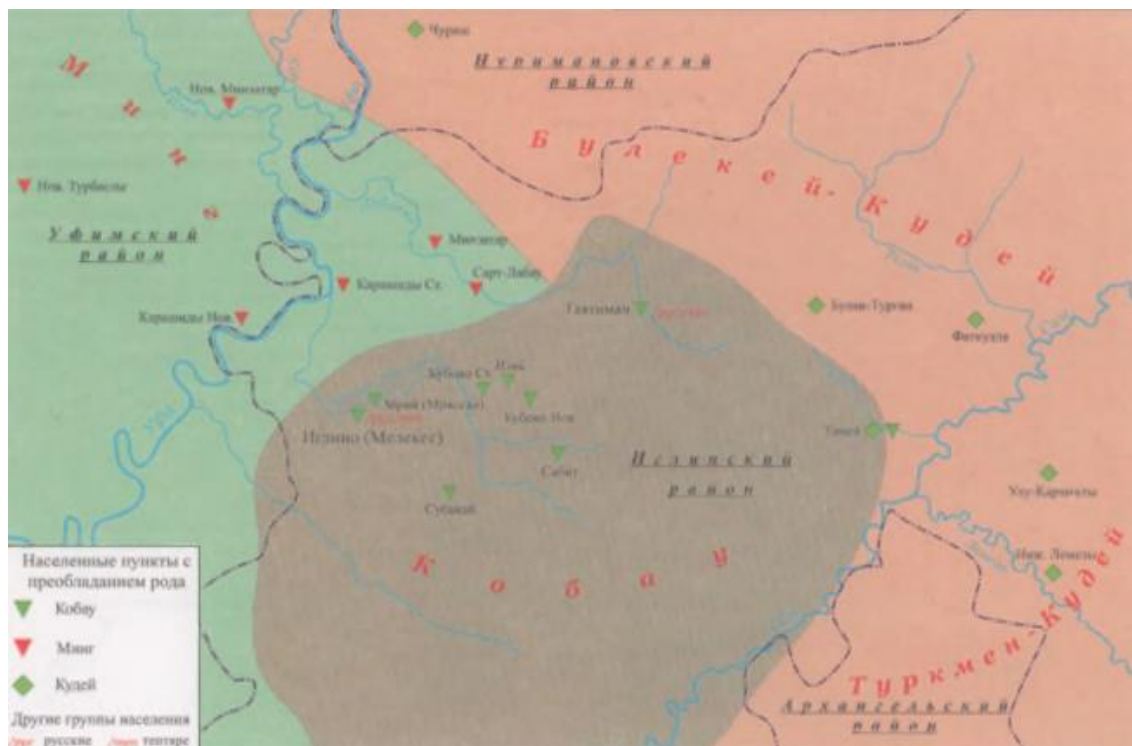
Рис.2. Расселение клана Кобау в Иглинском районе Башкирии

Выборка башкир из рода Кобау составила 9 образцов из дд. Старокубово и Новокубово. Исторически считается что д.Новокубово является выселком д.Кубово (Старокубово).