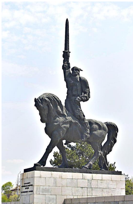
Фото 1. Памятник древнеболгарскому хану Аспаруху сыну Кубрата в городе Добрич

Возвращаясь к теме языка, отмечу, что в пользу тюркоязычия средневековых алан можно также привести и тот довод, что Къарча – предводитель предков карачаевцев и его соратники после разгрома Алании Тамерланом, собрались вновь в единый народ. Есть все основания полагать, что заново собранный народ был тюркоговорящим. Т.к. задолго до XIV века аланы уже известны как тюркоязычный народ, к примеру, в Юань-Ши аланские военачальники упоминаются под тюркскими именами, также существуют свидетельства хронистов – Абульфеда и других[31], что средневековые аланы и асы были тюркоязычными народами.