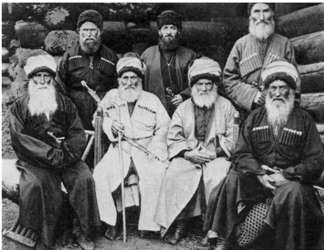
Репринт 1. Карачаевцы, аул Карт Джурт. 1867 г.

Женские линии карачаевцев и балкарцев также не имеют связи с потомками половецко-кипчакских кланов[13], лишь незначительный восточно-сибирский компонент в аутосомах может свидетельствовать в пользу участия половцев и кипчаков в этногенезе карачаевцев-балкарцев, но этот же компонент можно увязывать и с другими тюркскими племенами, к примеру с древними болгарами.