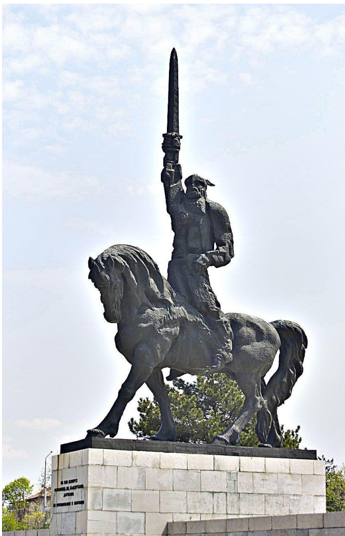
Фото 1. Памятник древнеболгарскому хану Аспаруху сыну Кубрата в городе Добрич

Древнеболгарские эпитафии имеют наибольшее сходство с татарским языком, а через него и с карачаевским и балкарским языками (т.е. с т.н. языками из «кипчакской» подгруппы языков).