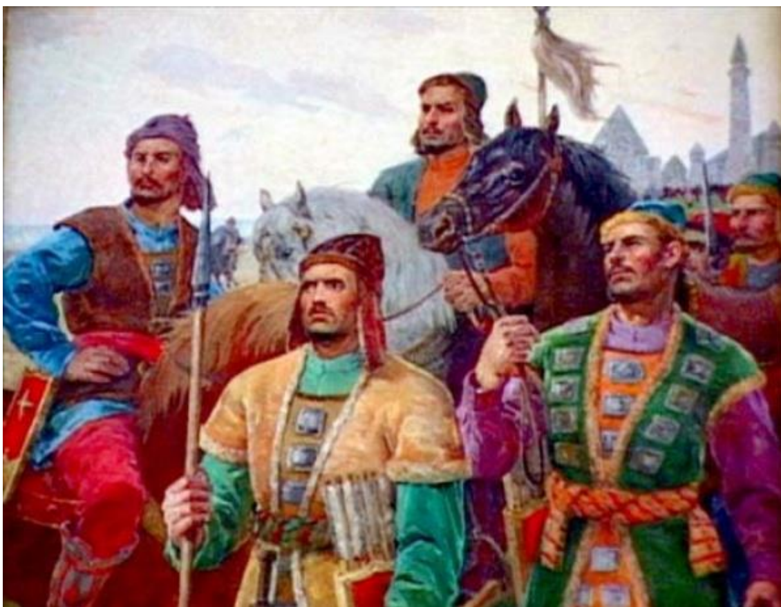
Рис.2. Волжские булгары

Из Кангхи вышли будущие печенеги-кангары[24], в связи с этим примечателен тот факт, что средневековый хронист, Аль-Бируни в частности отмечал, что язык у асов и алан напоминает языки хорезмийцев и печенегов[25].