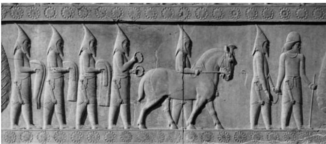
Репринт 3. Туран — мир всадников, незнающих над собой владык (асы, аланы, сарматы, саки, скифы, массагеты, дахи, даи, аорсы и другие)

Также у нас нет никаких письменных источников, которые могли бы подтвердить, что аланы в нач. н.э. говорили уже на тюркском языке. Предполагаю, что предки балкарских и карачаевских R1a-CTS1806 прошли процесс тюркизации в период Тюркского каганата, а основными тюркизаторами вероятно выступили древние болгары, в союзе с которыми находились алано-аские племена.