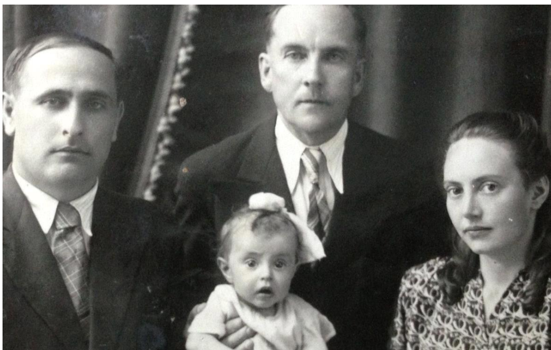
Фото 2. Фенотип адыгов Хлечас, Y-DNA гаплогруппа неизвестна

Вот, к примеру, выдержки из работ по данным антропологии древних алан, осетин, адыгов и др.