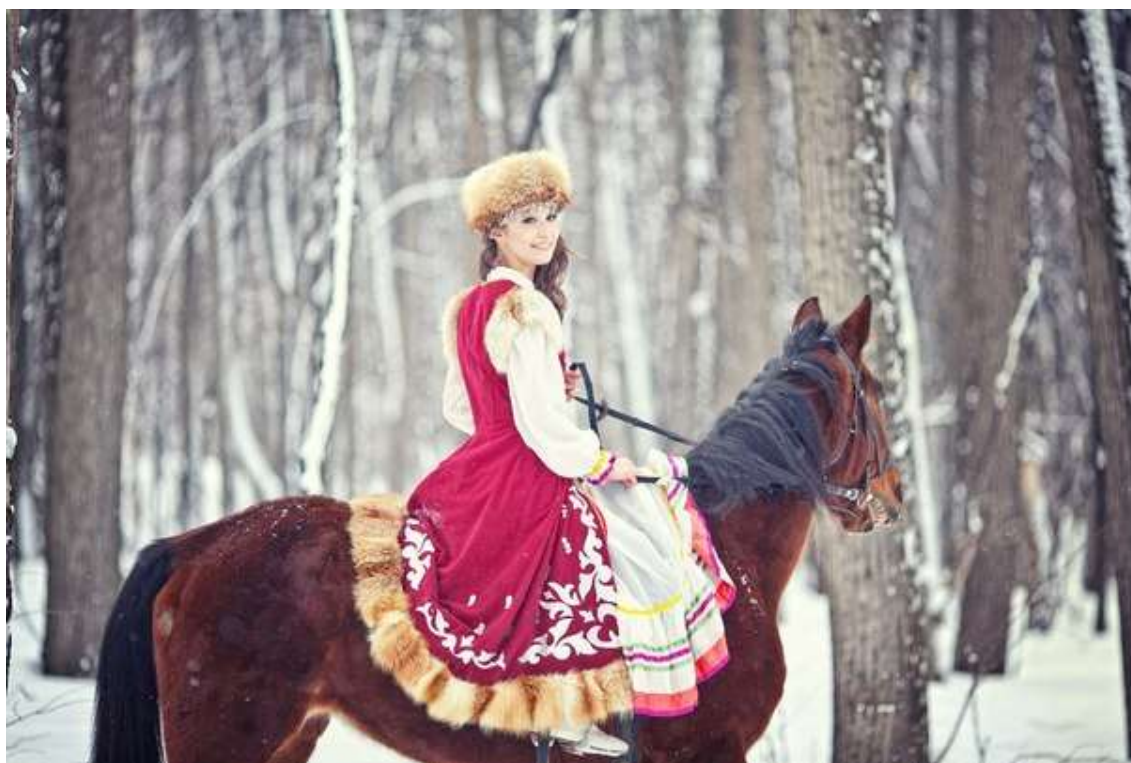
Фото 2. Башкирка