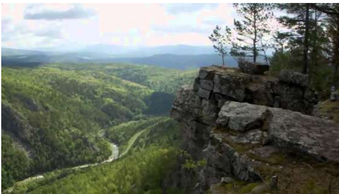
Фото 7. Южный Урал

Урал (башк.) — Ур эл (нахск.) — ‘пророк, господин’. Ур — на нахских языках — ‘высокий, высота’, Іуріе — ‘заря перед рассветом’.