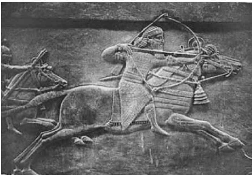
Репринт 1. Хурритский воин

Апанды, абазы (башк.) — Аб (нахск.) — ‘вечность, вечный’, ‘то, что не имеет, ни начала, ни конца’.