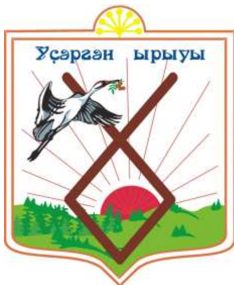
Репринт 2. Одна из эмблем усерганских башкир

сражающегося за правду или являлось обозначением сарматов[25]. Также один из родовых атаулов усерганских башкир носил название Ейән Сура, что значит ‘внук Суры’, по названию которого назван современный Зианчуринский район Башкортостана, в прошлом родовые земли усерганских башкир.