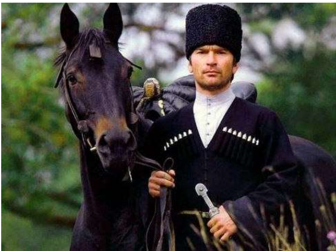
Фото 6. Чеченец в каракулевой папахе

Усергъан (башк.) – Іу-сургъан (Іу – 'стражник, пастух, надсмотрщик, хранитель' и т.д.; сур – 'воин, войско'). Второе значение – 'охраняющий скот, хранитель каракуля' (Іу-сургъан). Усергане разводили скот, а главным богатством обладали те, у кого было много скота, они носили каракулевые папахи. Собственно отсюда второе название мюйтенов – каракалпаки – 'чёрные шапки', которые они носили. Третье значение Іу-сергъан – 'охраняющий (Іу – 'стражник, пастух, надсмотрщик, хранитель' и т.д.) быков'.