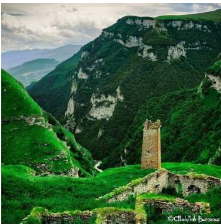
Фото 5. Чечня

В связи с чем исследователь Л.С.Толстова отмечала, что, в ономастике Хорезмского оазиса, как и в долинах Зеравшана (в какой-то мере и в Средней Азии в целом), сохранились следы, как древних языков иранской группы, так и слабые отголоски (некоторых элементов лексики, отдельных словообразовательных аффиксов, некоторых фонетических закономерностей) древнейших распространенных здесь в прошлом доиранских языков.