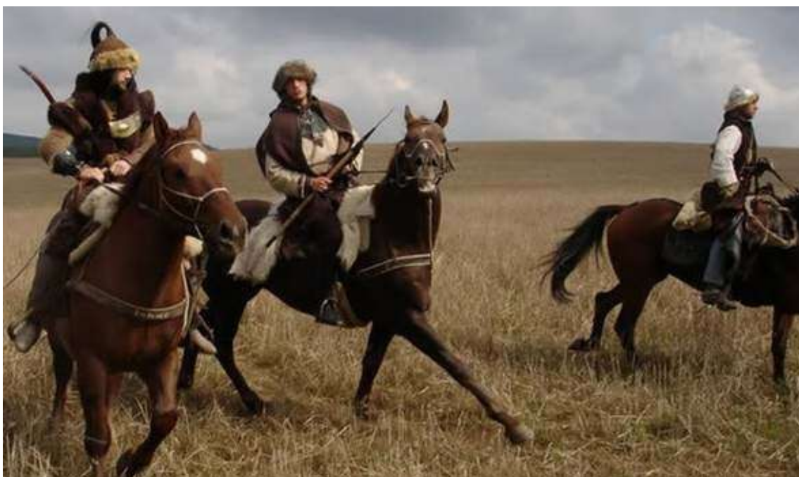
Фото 3. Башкирские усергане (муйтены)

Мы же придерживаясь версии С.П.Толстова, отметим в связи с этим, что Хорезм, с хурритских языков – Хурийа – дословно означает ‘страна где восходит Солнце’, в противовес Сирии – Сурийа, что на хурритских языках значило наоборот ‘страну где заходит солнце’.