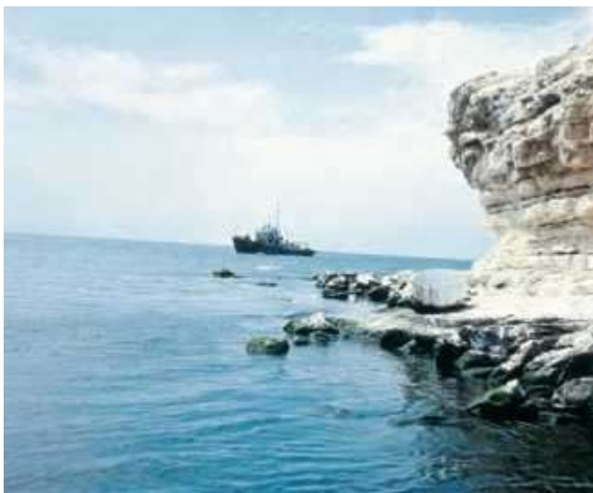
Фото 1. Аральское море

Родовые подразделения бешей и кара-бешей встречаются также среди кыргызов Тянь-Шаня[6]. Этот факт примечателен тем, что часть предков кыргызов Тянь-Шаня, ранее проживала в Приаралье[7], более того среди кыргызов у клана басыз встречаются носители гаплогруппы J2[8].