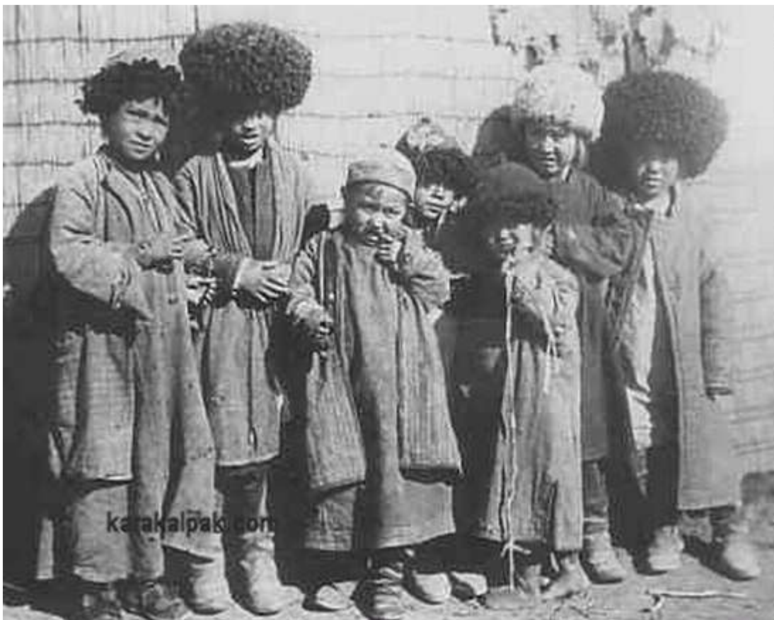
Фото 4. Каракалпакские мюитены

Также согласно Л.С.Толстой, в узбекском шежере (родословной), приводимом в работе Ч.Валиханова, в числе предков узбеков названы матиены (мотиян).